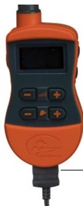
OPLAADSTEKKER IN OPLAADAANSLUITING VAN DE AFSTANDSBEDIENING

Opmerking: De levensduur van de batterij tussen de oplaadbeurten is ongeveer 50 tot 70 uur, afhankelijk van de gebruiksfrequentie.