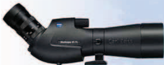
Victory DiaScope 65 T* FL 45° version coudée réf. ZE528063 - 1860 €