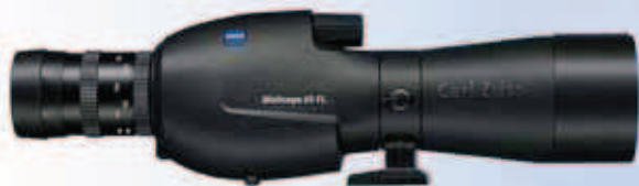
Victory DiaScope 65 T* FL version droite réf. ZE528062 - 1860 €

La solution légère, compacte et performante, idéale pour les voyages au long cours. Prédestinée pour un usage intensif en montagne et sur des terrains difficiles.