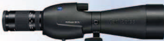
Victory DiaScope 85 T* FL version droite réf. ZE528064 - 2445 €

Le superlatif optique avec son objectif de grand diamètre pour un maximum de luminosité, un modèle destiné aux amateurs d'observations précises à longue distance.