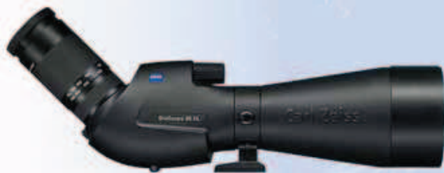
Victory DiaScope 85 T* FL 45° version coudée réf. ZE528065 - 2445 €