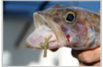
4 couleurs naturelles